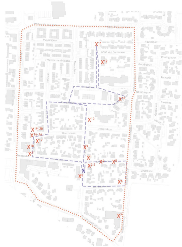
De gelopen route

De Oranjebuurt is een levendige wijk met een rijke historie, waar we samen met de buurtbewoners aan de slag willen met het verduurzamen van de huur- en koopwoningen en met het verbeteren van de leefbaarheid in de wijk.